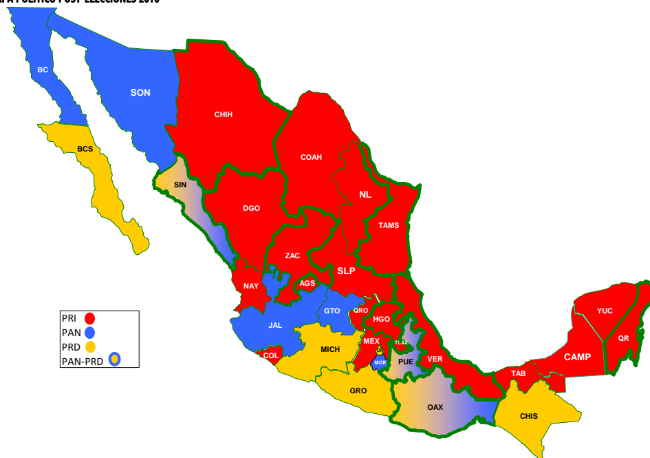
MAPA POLÍTICO POST-ELECCIONES 2010