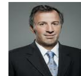
José Antonio Meade