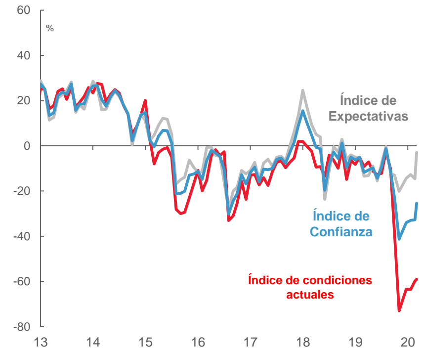
Índice de Confianza del Consumidor

La confianza del consumidor mejoró en agosto frente a lo visto en julio. Las expectativas sobre mejores condiciones del país impulsaron la recuperación del índice.