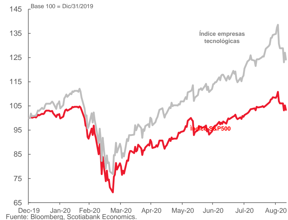
Evolución índice S&P 500 vs Índice de empresas tecnológicas

Con el fin de la temporada de vacaciones en EEUU, los mercados financieros enfrentaron fuerte volatilidad ante la corrección de las empresas del sector tecnológico