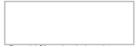
Firma del Cliente (con lapicero tinta negra, sin sobrepasar el recuadro)