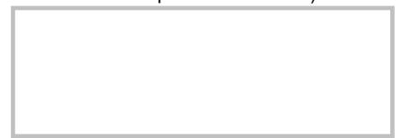
Firma del Cliente (con lapicero tinta negra, sin sobrepasar el recuadro)

_____ Sello y Firma del Responsable de la Atención