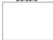
Huella Digital Índice Derecho