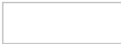
Firma del Cliente (con lapicero tinta negra, sin sobrepasar el recuadro)